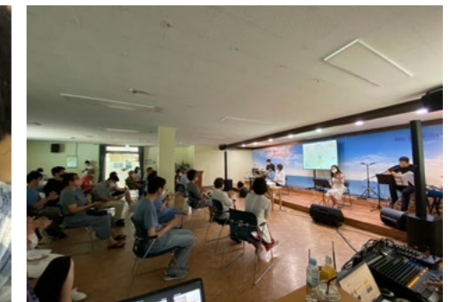
친구가 있어 좋은 날, 최고 멋진 날-공연