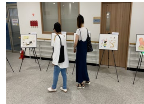
그림책 원화 전시