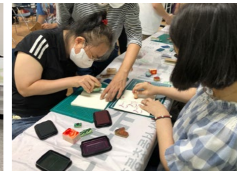
그림책 캐릭터 수첩 꾸미기